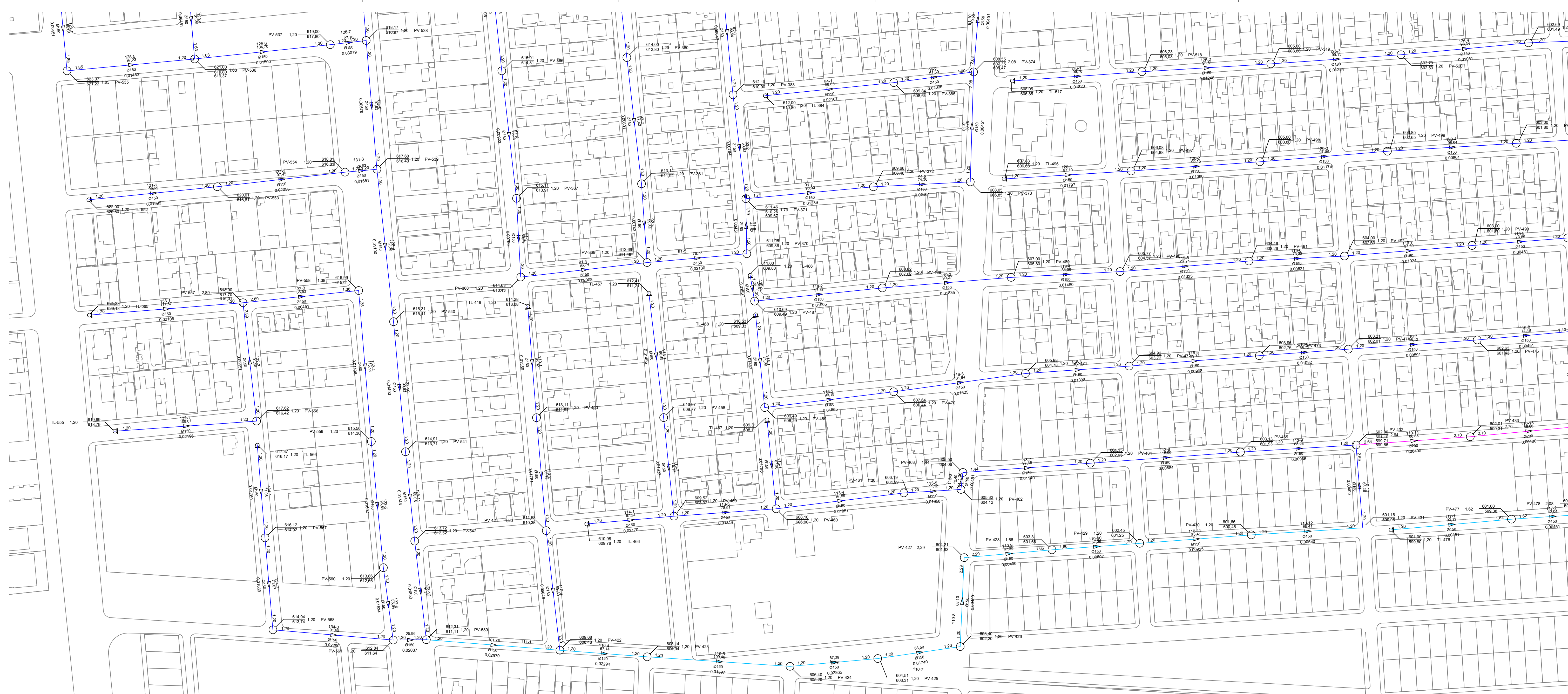
01 ESC REDE COLETORA DE ESGOTO - FASE 01 1:1500 PLANTA BAIXA - PARTE 4/9